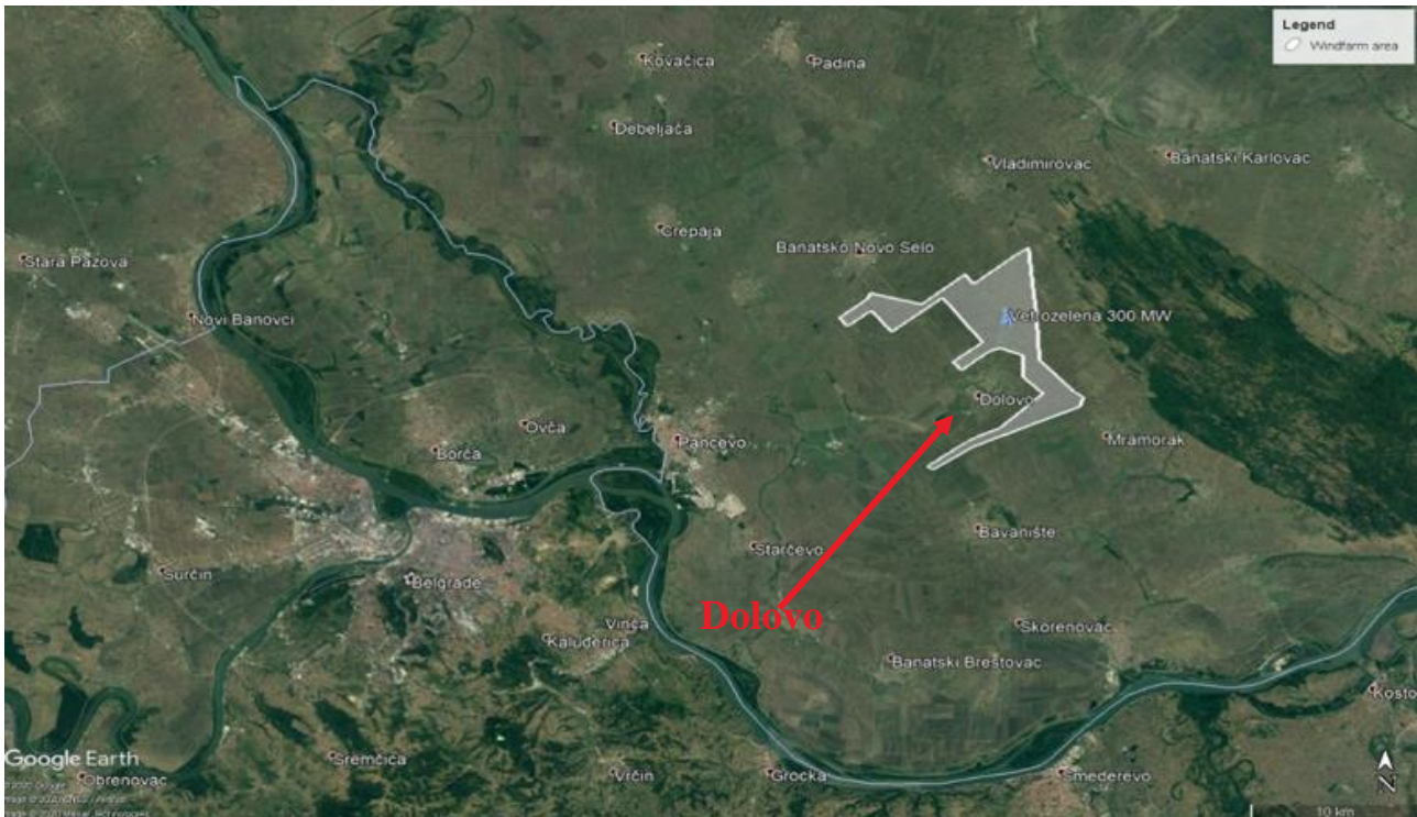
Slika 1 Lokacija Projekta

Najbliže naselje je Dolovo, jugoistočno od lokacije, gde se najbliže stambene kuće nalaze oko 1-2 km od granice lokacije. Drugo najbliže naselje je Banatsko Novo Selo na severoistoku, kao i Mramorak na jugozapadu. Za svako od ovih naselja, najbliže stambene kuće su više od 2 km udaljene od granice lokacije.